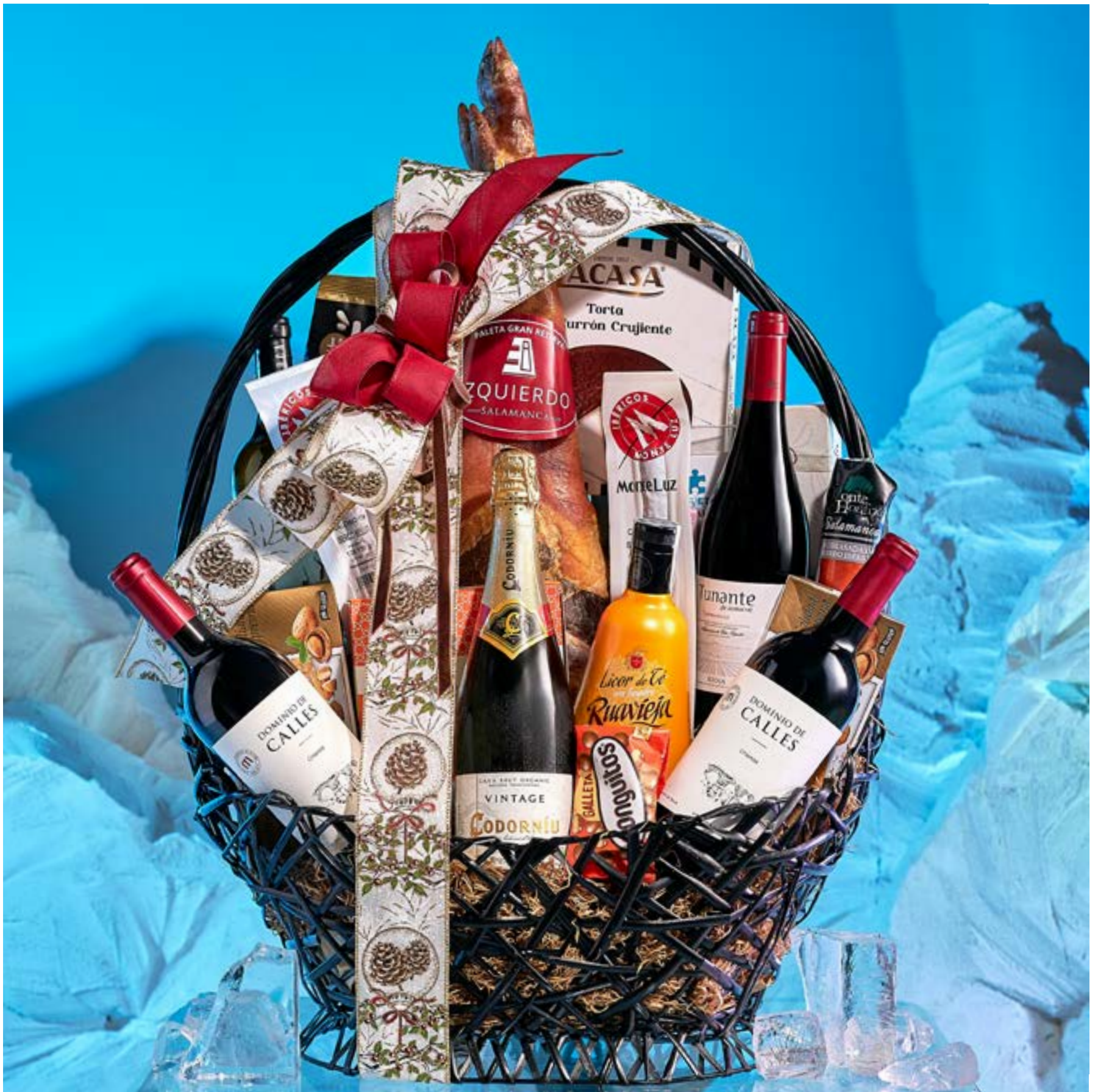
La cesta 502 se presenta decorada con cintas y envuelta en tul.