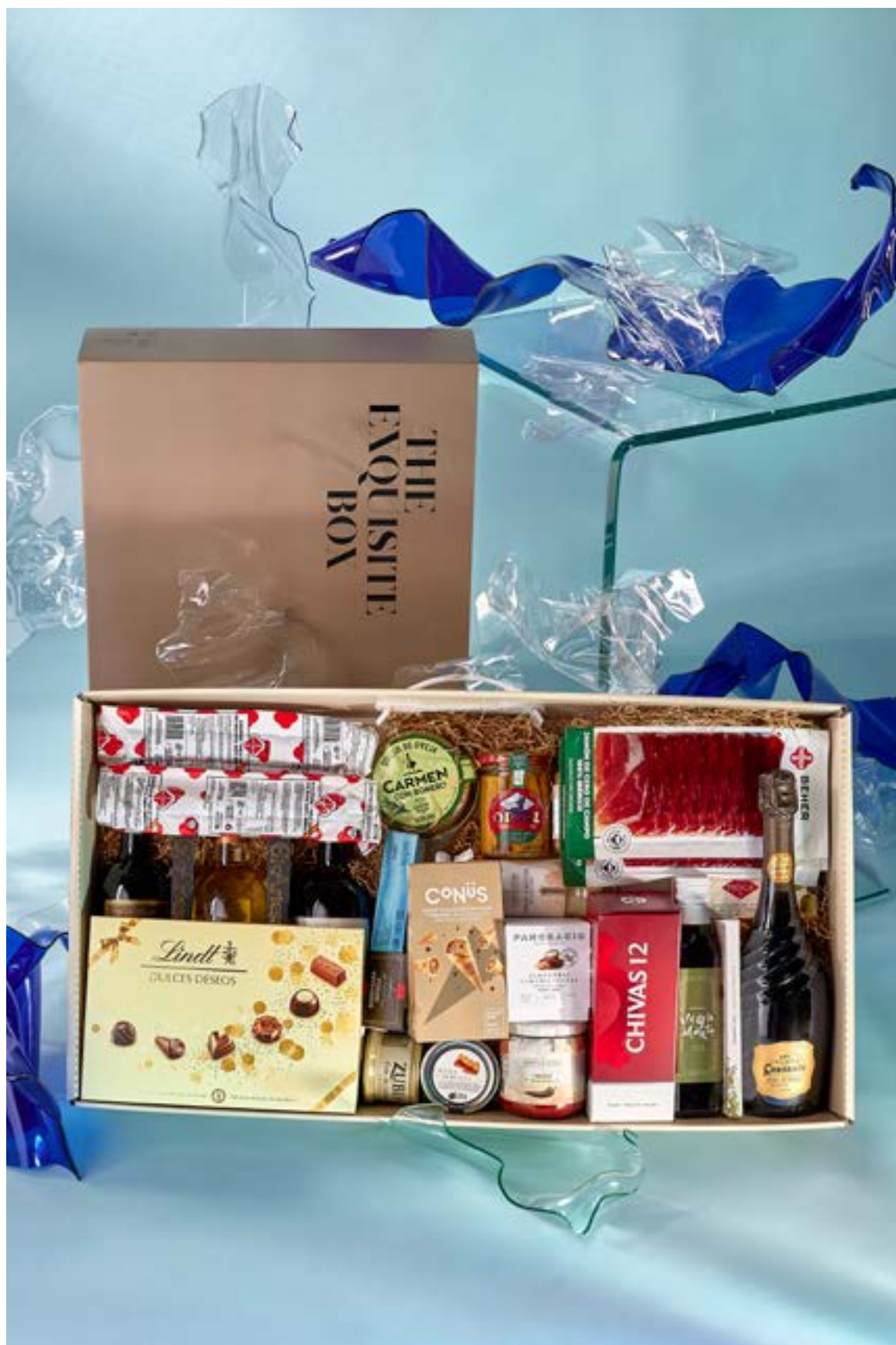
LOTE THE EXQUISITE BOX 305 REF. 4D2CTEB305 - 174,20€ 195,76€ IVA INC.