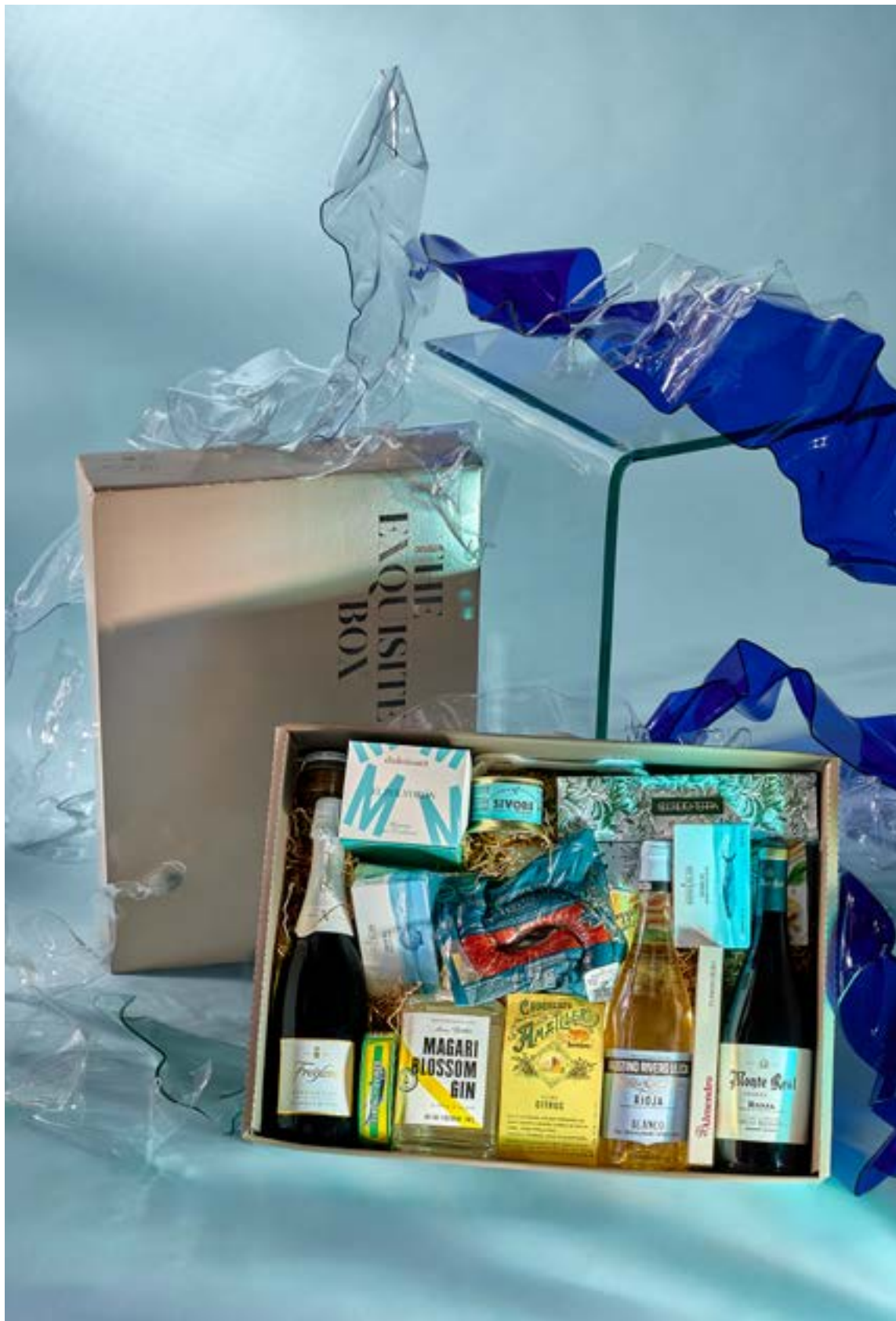
LOTE THE EXQUISITE BOX 309 REF. 4D2CTEB309 - 80,27€ 91,18€ IVA INC.