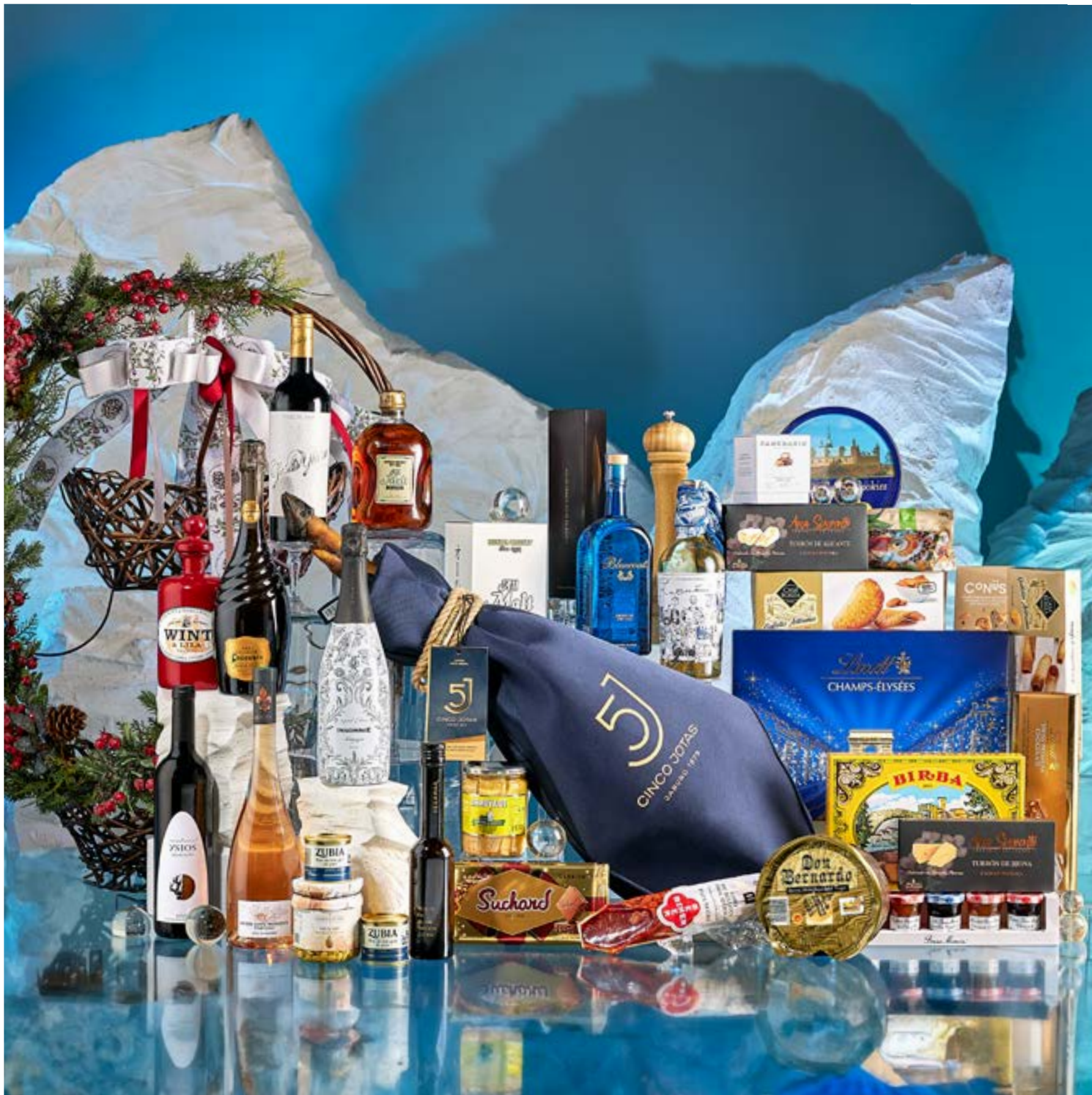
La cesta 510 se presenta decorada con cintas y envuelta en tul.