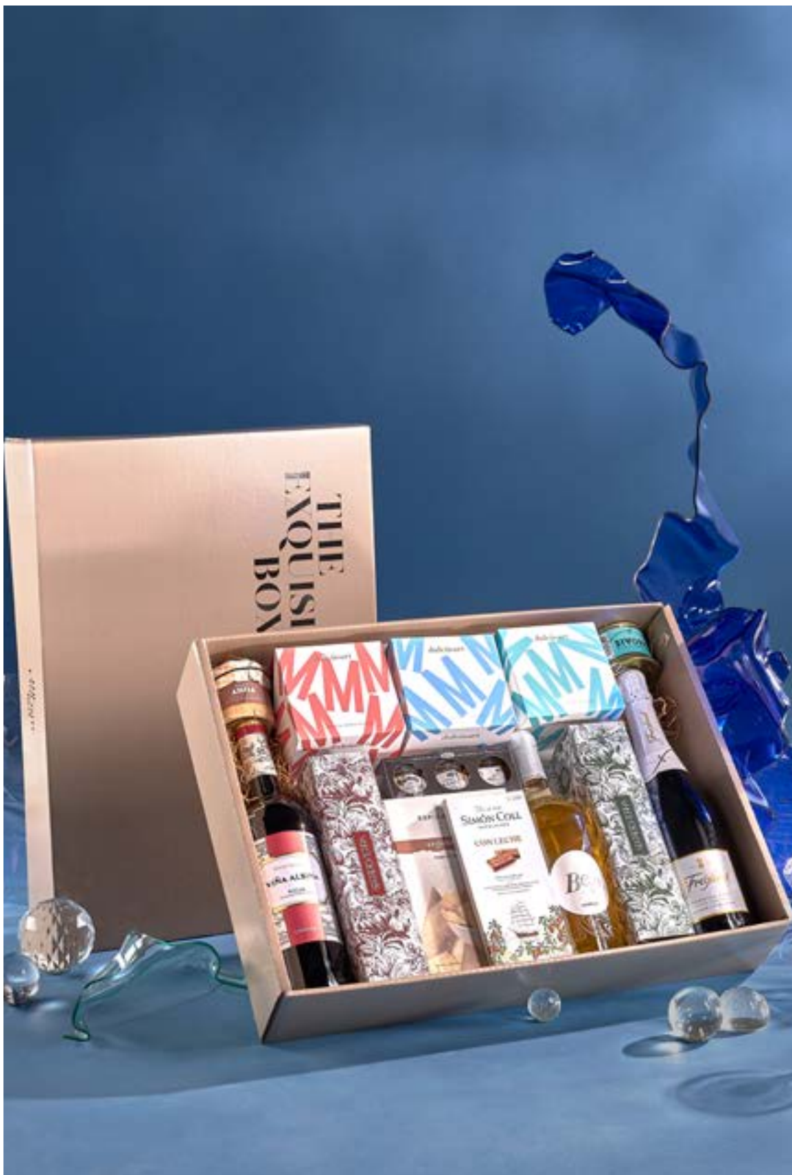
LOTE THE EXQUISITE BOX 320 REF. 4D2CTEB320 · 46,92€ 53,33€ IVA INC.