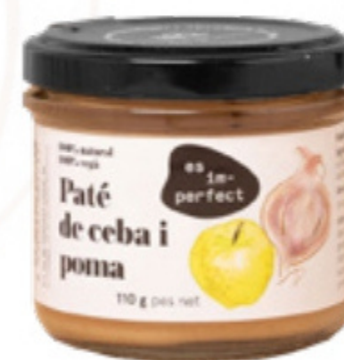
Paté de Ceba i Poma 110gr Im-perfect