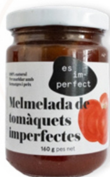
Melmelada Tomàquet 160g Im-perfect