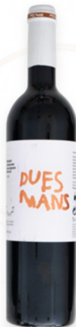
Vi Negre Dues Mans d'Urpina Ampans