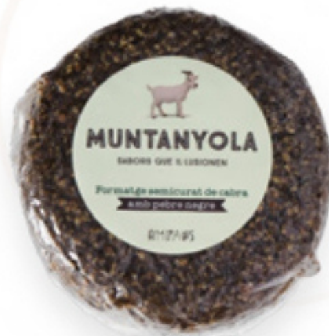
Formatge de cabra semicurat amb pebre negre Muntanyola Ampans