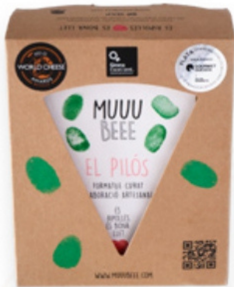
Formatge madurat de vaca El Pilós MUUU BEEE