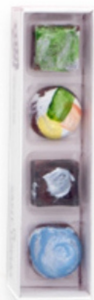
Caixa 4 bombons de xocolata Sant Tomàs