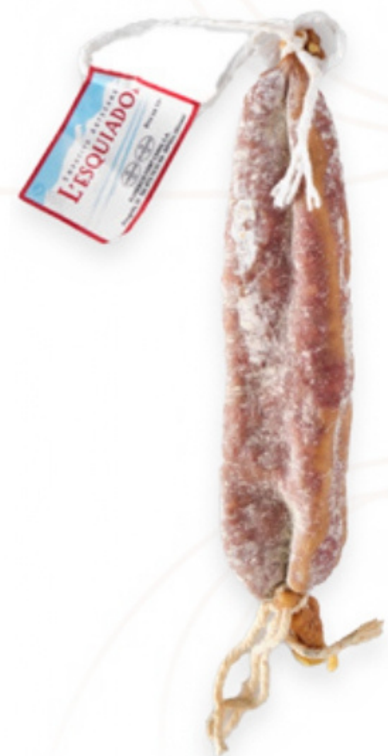
Llonganissa extra al buit. L'Esquiador Ripollès