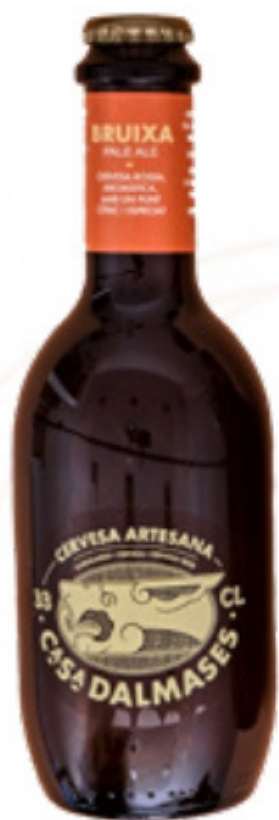
Cervesa Artesana Bruixa 33 cl (Pale Ale) Rossa