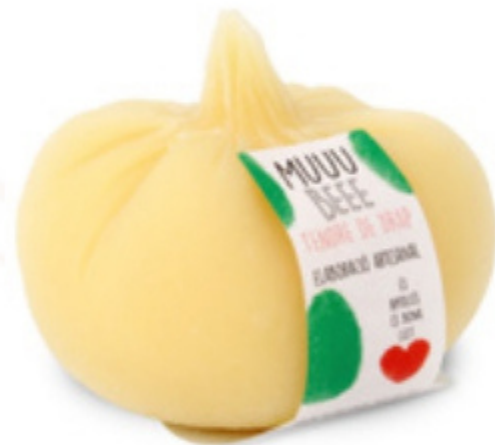
Formatge tendre de vaca Tendre de Drap MUUU BEEE