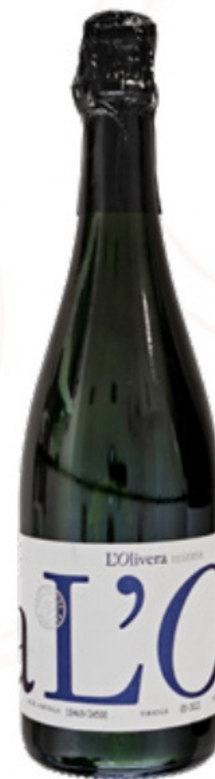
Cava L'Olivera Reserva Brut Nature L'Olivera