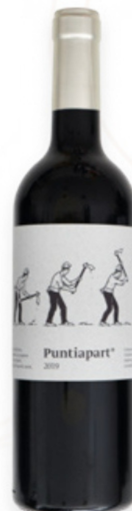
Vi Negre Puntipart La Vinyeta