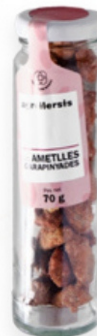
Pot ametlla garrapinyada 70g. Agroilersis