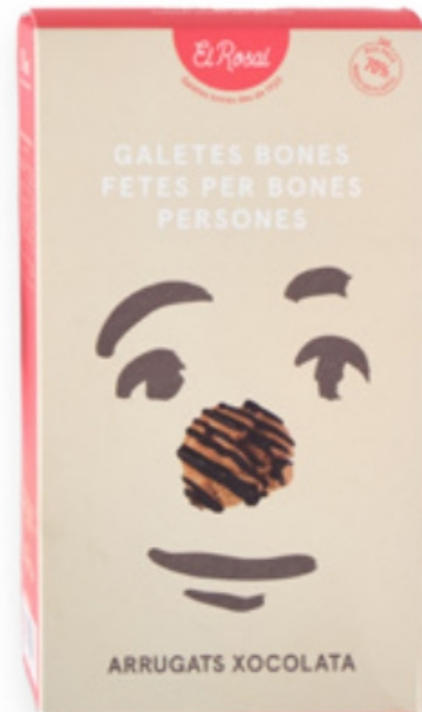
Arrugats xoco pack col·lecció 125gr (15 galetes) El Rosal