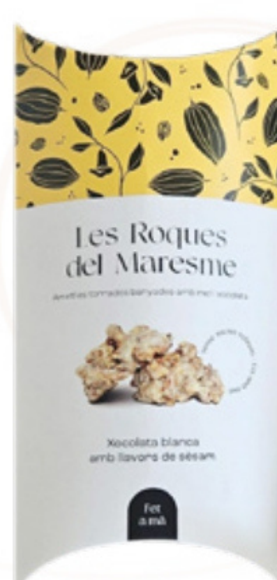
Petaca de roques xocolata blanca i sèsam 80gr