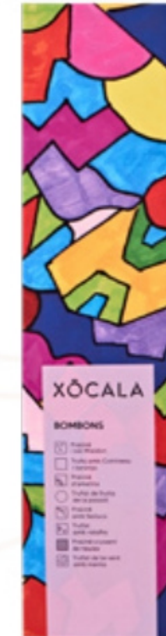
Caixa de bombons (6unitats) Xócola Hi som