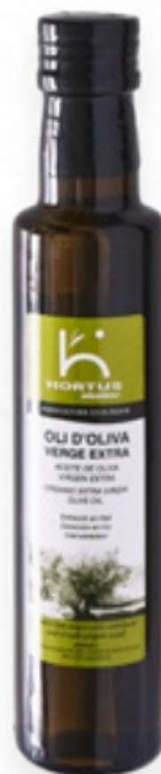
Oli d'oliva verge extra ecològic 250 ml. Aprodisca