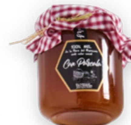
Mel de mil flors 250ml Can Percala Fundació Maresme