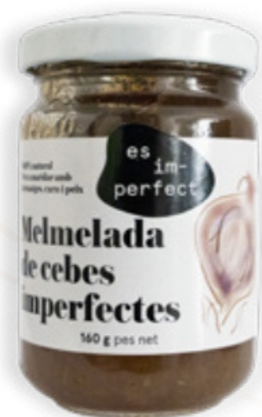
Melmelada Ceba 160g Im-perfect