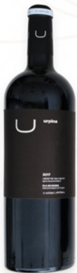
Vi Negre U d'Urpina Ampans