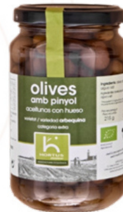
Olives arbequines ecològiques 215g Aprodisca