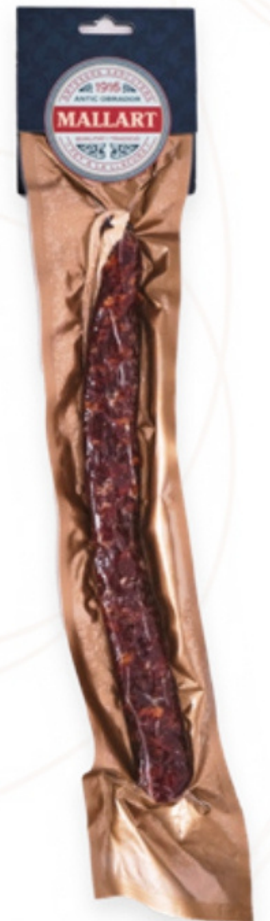
Fuet Extra 190g Mallart