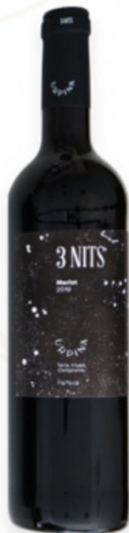
Vi Negre 3 Nits d'Urpina Ampans