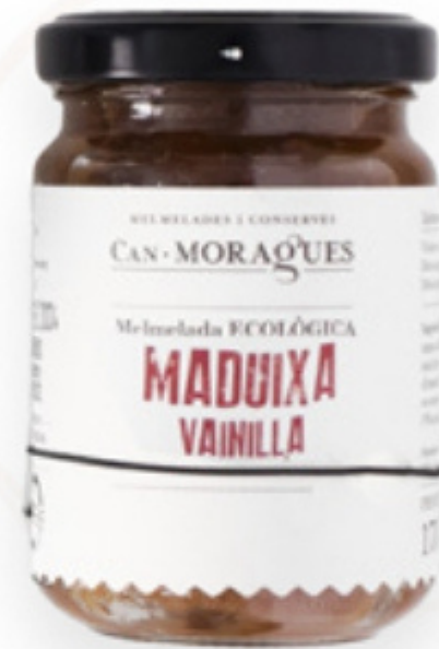
Melmelada de Maduixa amb Vai- nilla 170g Can Moragues