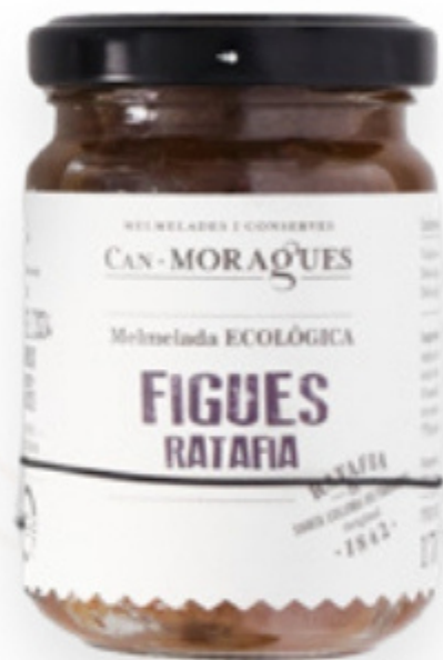
Melmelada de Figes amb Herbes de Ratafia 170g Can Moragues