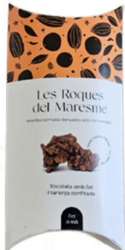
Petaca de roques xocolata amb llet i taronja confitada 80gr