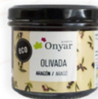
Paté d'oliva d'Aragó 100g Aliments Onyar