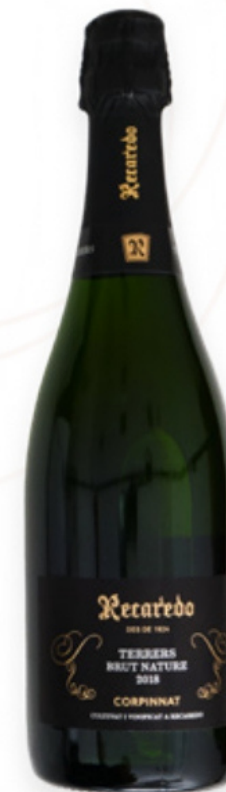
Corpinnat Terrers 2019 Brut Nature llarga criança. Recaredo