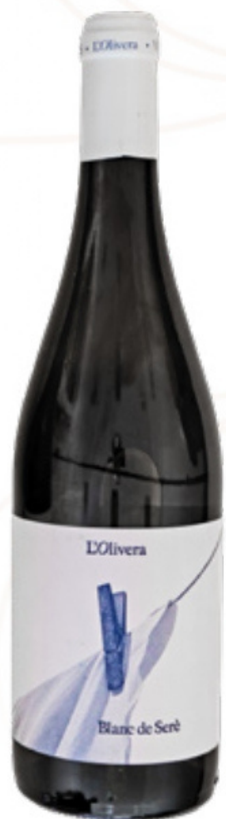
Vi Blanc Blanc de seré L'Olivera