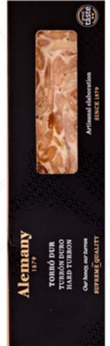
Torró dur Alemany 250gr