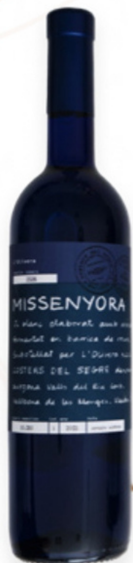
Vi Blanc Missenyora L'Olivera