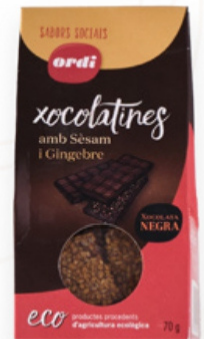
Xocolatines amb sèsam i gingebre 70gr ECO Ordi Natura