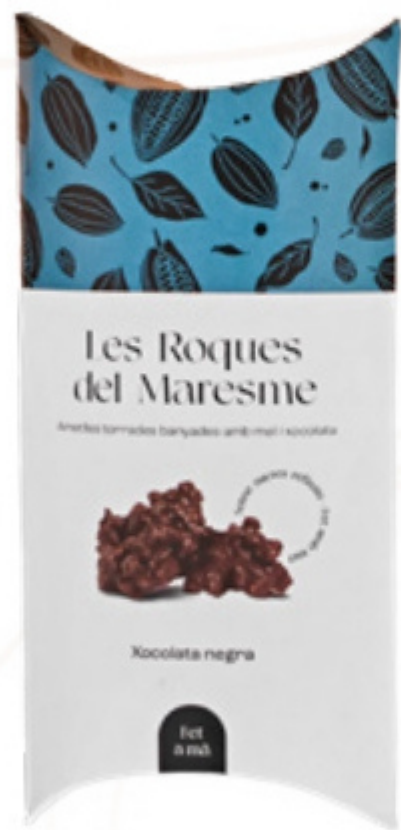
Petaca de roques xocolata negra 80gr