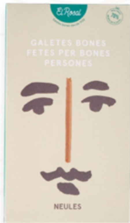
Neules pack col·lecció 140gr (20 galetes) El Rosal