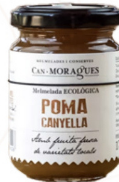
Melmelada de Poma amb canyella 170g Can Moragues