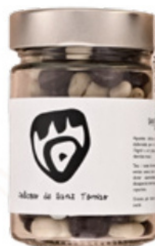
Les Delícies 130g Sant Tomàs