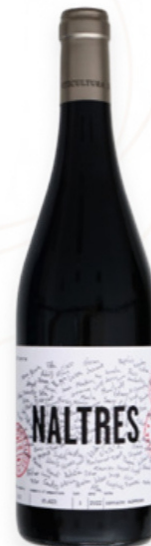
Vi Negre Naltres L'Olivera