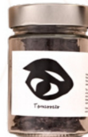
Tomassets Rocs de patates fregi- des i xoc negra 100g. Sant Tomàs