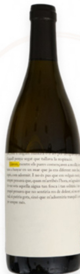
Vi Blanc Llavors La Vinyeta