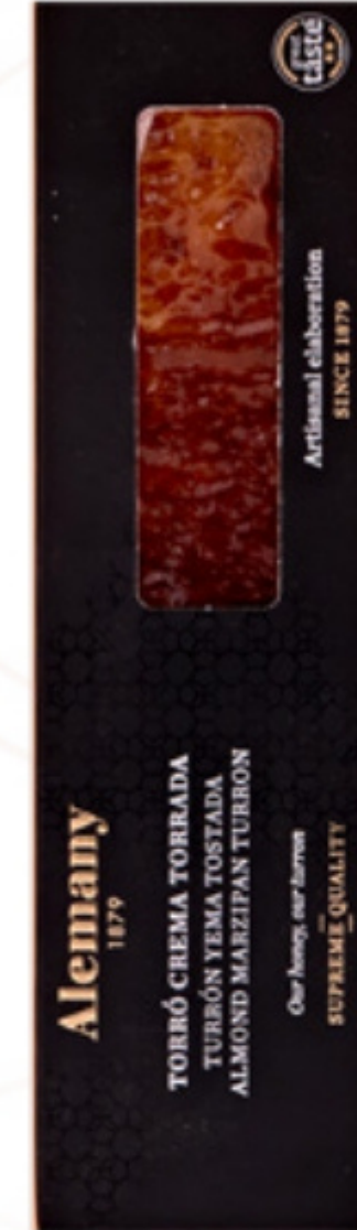
Torró de Crema Cremada Alemany 250gr.