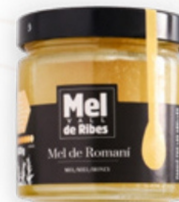
Mel de Romaní de la Vall de Ribes 500g