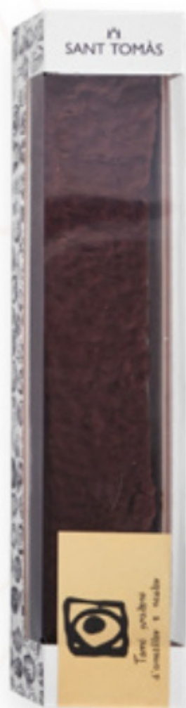
Torró de xocolata, praliné d'ametlles i neules, 150g Sant Tomàs