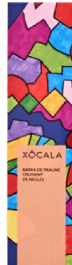
Torró praliné cruixent de neules del Rosal Xócola Hi Som