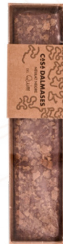
Torró Neulat de xocolata negra (70% cacau)125 g. Casa Dalmases