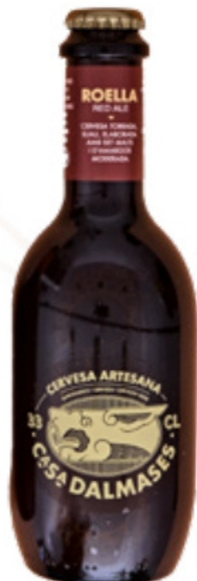
Cervesa Artesana Roella 33 cl (Red Ale) Torrada