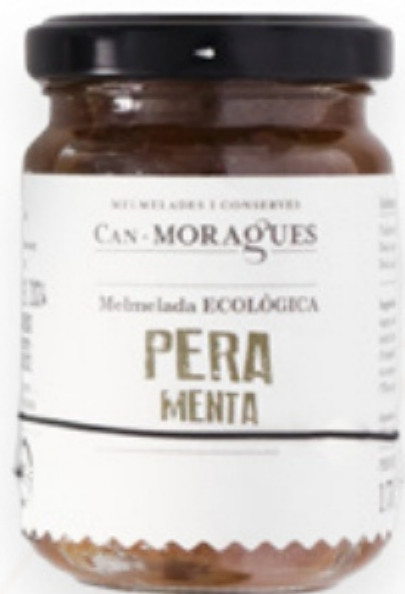
Melmelada de Pera amb Menta 170g Can Moragues